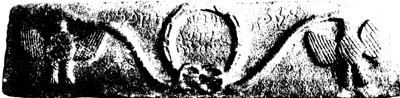
משקוף בית-המדרש של רבי אלעזר הקפר מדבורה שבגולן

נחשוף ממצאים רבים הקשורים בהם. אולם לא כן הוא. יש בארץ-ישראל עדות ארכיאולוגית ברורה על בתי-כנסת רבים במספר, ורק עדות אחת על בית-מדרש — כתובת שנמצאה על משקוף בדבורה; ואף זאת בלי שנמצאו לפי שעה שרידיו של המבנה. נוסף על אלה יש ממצאים המרמזים על ארבעים בתי-כנסת נוספים, אך רק שרידים לא ודאיים של ארבעה בתי-מדרש. ועוד בחמישים וחמישה מקומות נוספים יש ממצאים המרמזים על כך שהמקום שימש כבית כנסת, ההגדרה אינה ודאית ויתכן שמקורם של ממצאים אלה במבנים ציבוריים אחרים. 14 אפילו לא אחד משרידים אלה אפשר לשייך בוודאות לבית-מדרש. אף-על-פי שלא מן הנמנע שיש ביניהם שרידים של בתי מדרש. על המשקוף מדבורה חקוק: 'זה בית מדרשו שהלרבי אליעזר הקפר'. בחורבת שמע שבגליל נמצא חדר סמוך לבית-הכנסת, שגודלו 5 מ' × 2 מ' בלבד, והוא לדברי החופרים אולי בית-מדרש. הוא הדין בחדר צדדי של בית-הכנסת המאוחר בחמת-טבריה, ששימש לדעת החופרים, 15 בית-מדרש. גם חדר צדדי בחמת-גדר שימש, לדעת סוקניק, בית-ספר או מוסד דומה לו. 16 במצדה נחשף חדר עם ספסלים לאורך שלושה קירות וספסל או שולחן נמוך באמצע וגם הוא שימש אולי בית-מדרש. בקצרין שבגולן נמצא בניין ציבורי המכוון אל הדרום; דבר זה מעיד, לדעת ד' אורמן, 17 שהיה זה בית-מדרש ולא בית-כנסת, אך אין בידינו עדויות אם היה כיוון מחייב לבית המדרש.