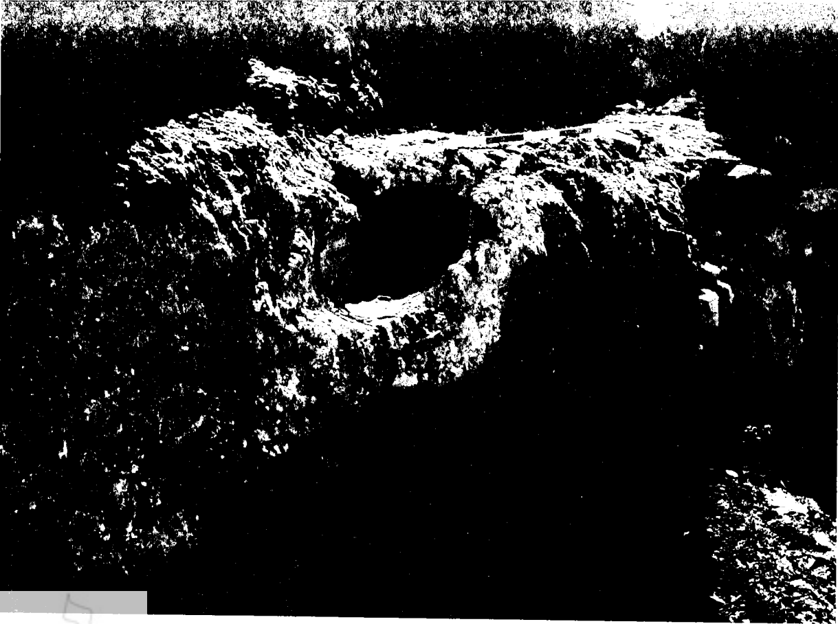
פרט של תשתית האמה העתיקה ובתוכה צינור החרס התורכי

ירושלים. חלק מקטע האמה שנחשף כאן בנוי על-גבי מערת-קברים שהושחתה ויצאה מכלל שימוש כתוצאה מכך (ראה צילום). לפנינו אפוא אמת-מים הבאה מבית-הקברות. 26 למי אמת-המים התחתונה נודע תפקיד חשוב בפולחן בבית-המקדש. זוהי האמה הבאה מעיטם אל הכיור והים שבבית-המקדש, ששימשו את הכוהנים לרחצה ולטהרה ולטבילת הכוהן הגדול ביום-הכיפורים. 27 בשל חשיבותה לפולחן ומשום שהיא חוצה בית-קברות, מתחייבות שתי מסקנות. (א)