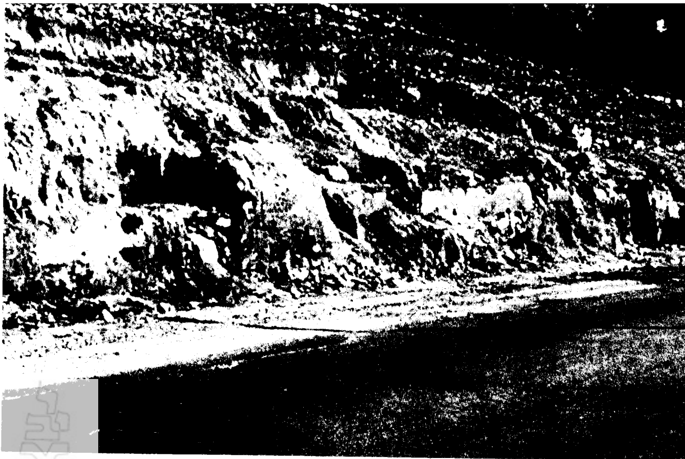
קטע של אמת-המים התחתונה חוצה מערת-קברים קדומה במדרון המערבי של ירושלים, מבט לדרום-מזרח. שנת לב לתשתית הבנויה של האמה שלתוכה שוקע צינור-חרס בתקופה התורכית

קיר הסכר הדרומי של בריכת א-סולטאן, כמה מערות-קבורה מסוף ימי בית ראשון (ראה מפה). כחלק מן המערות התחדשה הקבורה בימי החשמונאים ונמצאו בהם כלי-חרס מסוף תקופת שלטונם. 24 גלוסקמה שבורה שהתגלתה בתוך 'קבר חפור' בסמוך מלמדת כי השימוש בבית-קברות זה נמשך גם בתקופה שכבר השתמשו בגלוסקמות לקבורה שנייה. 25 כחלקו הדרומי של קו המערות נחשף קטע של אמת-המים התחתונה, המובילה מים מן המעיינות שבאיזור בריכות-שלמה אל