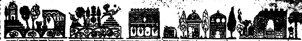
המגדל מעוז ארזה לזמן שנים / המדרגות במאבק המדרש / חזקאל הנביא הנגמר בבבל המדרש / יצחק בן עקיבא / זהו הר הזיתים אשר עליו מערת של כל הנביאים וה יריקים הקדושים הנפדים בעור הקדש תובל