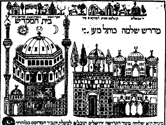
בית המקדש / מדרש שלמה כחל מעון... / מינחה היא שלחה מעד הקדושה ירושלים תובל...