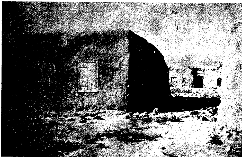
החוושה באום-גי'וני, ששימשה משרד לקבוצה

היה סעיף כזה)... 42 המדובר ב'התחייה', שמרכזה היה בפניסק (ולא 'התחייה' הווארשאית). היתה זו תנועה שהתלכדה מאגודות של צעירים ציונים מרחבי הקיסרות הרוסית (ועד לליטא הגיעו); ולאחר ועידתה הארצית ביוני 1906 לא האריכה ימים. אף-על-פי-כן מן הראוי לבחון את אחד מסעיפיו של המצע שהתקבל בוועידה זו, לפי שממנו אפשר ללמוד על הלכידות מסוימים: