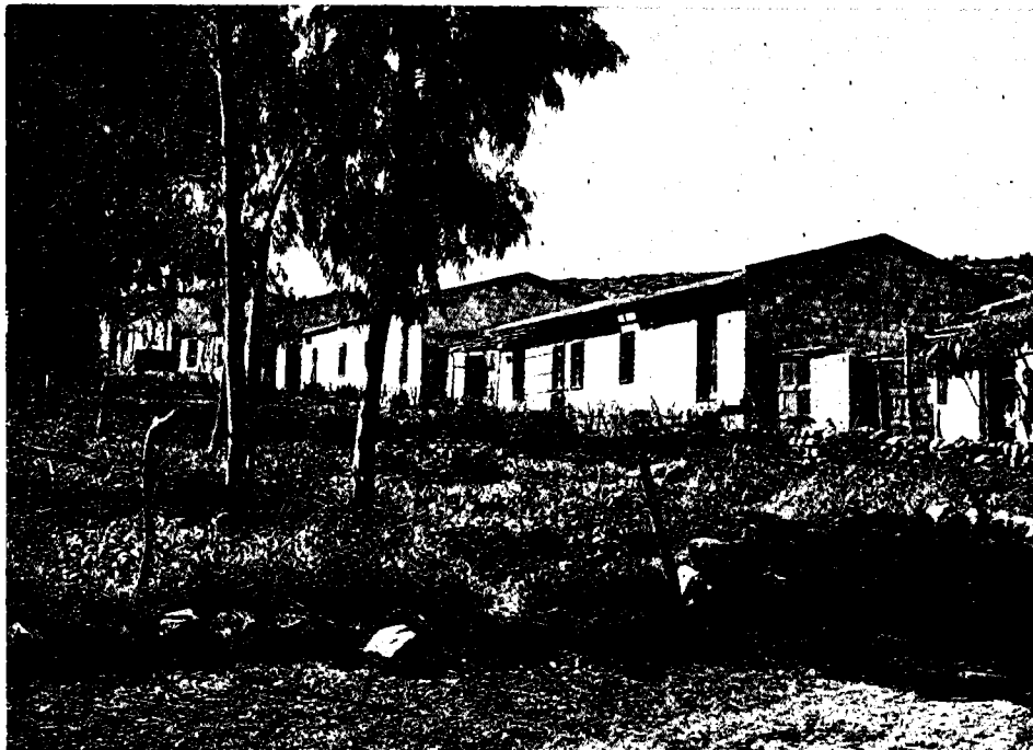
חוות סג'רה, 1912

ולהלן פירוט המטרות האחרות: בדיקה כלכלית של כדאיות המשק החקלאי; בדיקת יכולתו של הפועל העברי להסתגל לעבודה החקלאית; הקטנת הגרעון של החווה; הגברת האמון בכוחו של הפועל העברי.