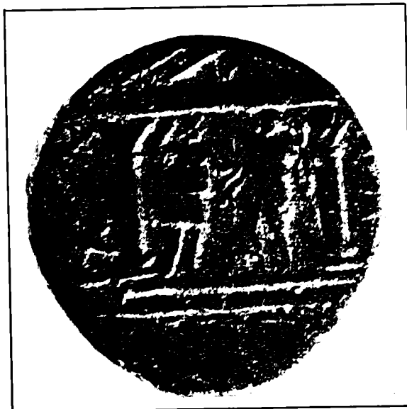
קֶסֶקְטִיוֹס – מטבע ארד רומי בערך של רבע דינריוס. הוטבע בעזה בשנת 130/1 לספירה, לרגל ביקור הדריאנוס. בתמונה נראה ה־Marneion, הוא מקדש האל העירוני מָרְנָא (מארמית: מָרְנָא, שמשמעו 'אדונו'). מתחת לגמלון של חזית המקדש נראה מרנא מימין, והאלה אֶרְטֶמִּיס משמאל.