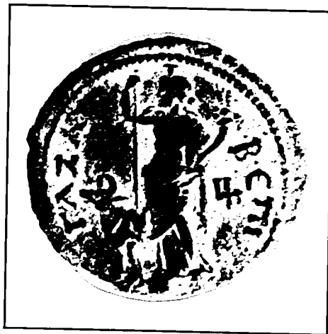
אָס – מטבע ארד רומי בערך של מחצית הדופונדיוס. הוטבע בעוזה בשנת 130/1 לספירה, לרגל ביקור הרדיאנוס. מימין – דמות אלת המול טִיבִי, היא גם אלת העיר. משמאל – דיוקנו של הרדיאנוס