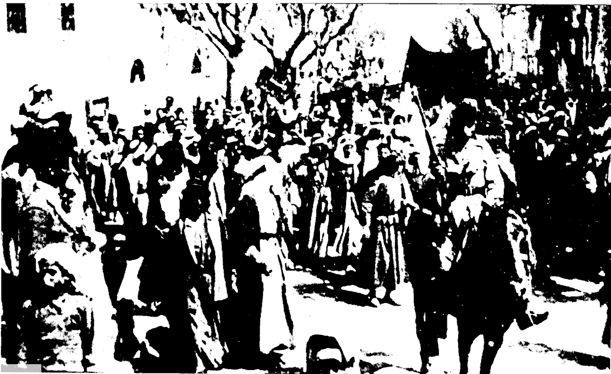
הפגנה של ערביי בית-שאן נגד הרברט סמואל, 1921. המפגינים נושאים דגלים שחורים

הם סירבו להודות כבעלות המדינה על הקרקע והצהירו כי מעולם לא הכירו בשלטון העות'מאני ובזכותו להפקיע את אדמתם.