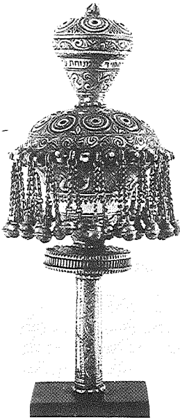
תמונה 1: רימון עם פעמונים, כסף, איראן, גובה 30 ס"מ (מחזיאן ישראל, ירושלים, צילום — דוד חריס)

מקור חשוב לתולדות היהודים באיראן בתקופה הצפונית והתקופות שאחריה הוא ספרי־מסע של נוסעים אירופים, מהם ספרים רבים שטרם נחקרו. כמה מספרי־המסע