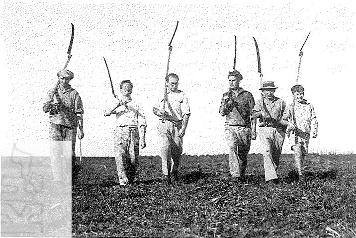
יוצאים לשדה, גבעת ברנר, 3 בפברואר 1937

התנועה הקיבוצית הייתה בדילמה באשר לפיתוח תעשייה בתוכה. בתנועה כולה שרר אתוס חקלאי מפורש, אך היו שהתנגדו בגללו להכניס תעשייה והיו שפיתחו את האתוס של המפעל היצרני הכולל תעשייה. בשנות הארבעים התפתחה התעשייה בגלל ה'קוניוקטורה', ההזדמנות. מציאותם של חיילים בריטים רבים באזור חיבת ייצור המוני של תעשיית המזון והרחבה של החקלאות. תגובתן של התנועות הקיבוציות על מצב זה היו שונות. 'הקיבוץ המאוחד' הצנטרליסטי, שבו כל יישוב הוא משק של הקיבוץ