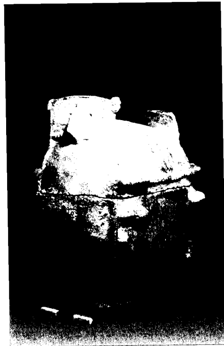
מימין: גלוסקמה שנתגלתה במערת נטיפים בפקיעין, מן התקופה הכלכלית, שבה היתה קבורת העצמות המשנית – מנהג נפוץ ביותר