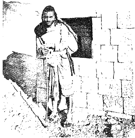
בדרך לארץ-ישראל (1906)