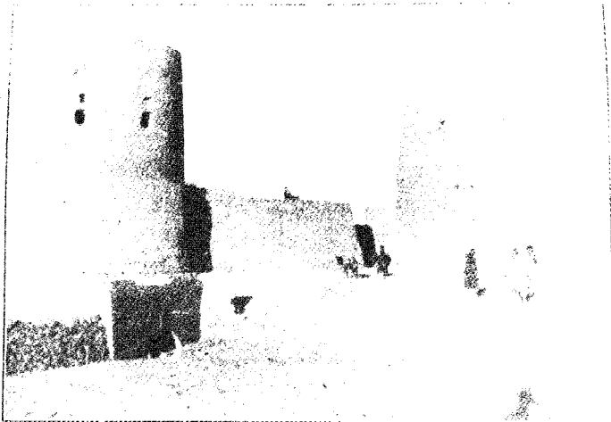
צנעא – שער חיזוני לרובע היהודי