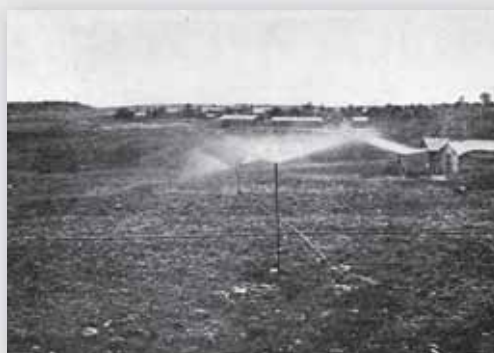
למעלה: תרשים פרישה מוצעת של תחנות המחקר והחוות החקלאיות מימין (מלמעלה למטה): המעבדה הכימית בתחנת תל-אביב; תחנת דגניה; תחנת בן-שמן. תצלומים משנות המנדט הראשונות

וגם נעשו ניסיונות בעבר, בשנים שקדמו למלחמת העולם הראשונה. הפיצול עורר ויכוחים. היו שדרשו להקים את החווה המרכזית בירושלים, והיו שהוסיפו לדבוק בשפלה. ועד להכרעה על מיקום התחנה המרכזית נוצר בכך-שמן מרכז למחקר בתחומי הפלחה וגידול בהמות ועופות, וביפו ובסביבותיה – מרכז למחקר נטיות. הפיצול הכביד ופגע בניהול התחנות, בעבודתן ובמחקריהן, והוחלט לחפש מקום חדש שיתאים לתנאים שהציב וולקני.