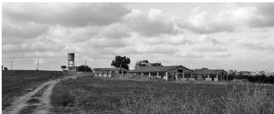
חוות-מרדכי, מראה כללי מכיוון דרום-מערב, ינואר 2009

במסגרת המאמצים של ארגון אונסק"ו (סוכנות החינוך, המדע והתרבות של האומות המאוחדות) לשמר נופים ונכסים שיש הסכמה רחבה על ערכם יוצא הדופן, חוברו אמנות שונות, בין-לאומיות ומקומיות. בכולן הוגדרו קריטריונים לבחירת הנכסים והנופים והוצגו דרכים לשמור עליהם, אך בלט בהן העיסוק בנכסים מוגומנטליים ובנופי טבע עוצרי נשימה. בשנת 1999 החליטו המדינות השותפות