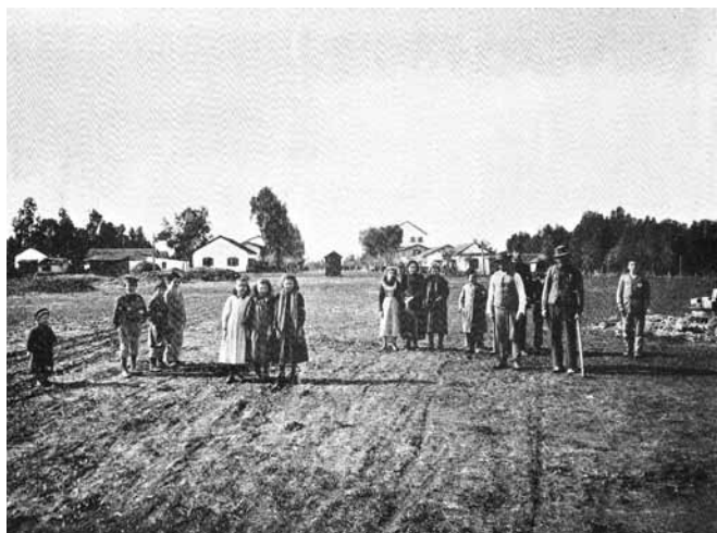
מזכרת-בתיא ותושביה, 1898