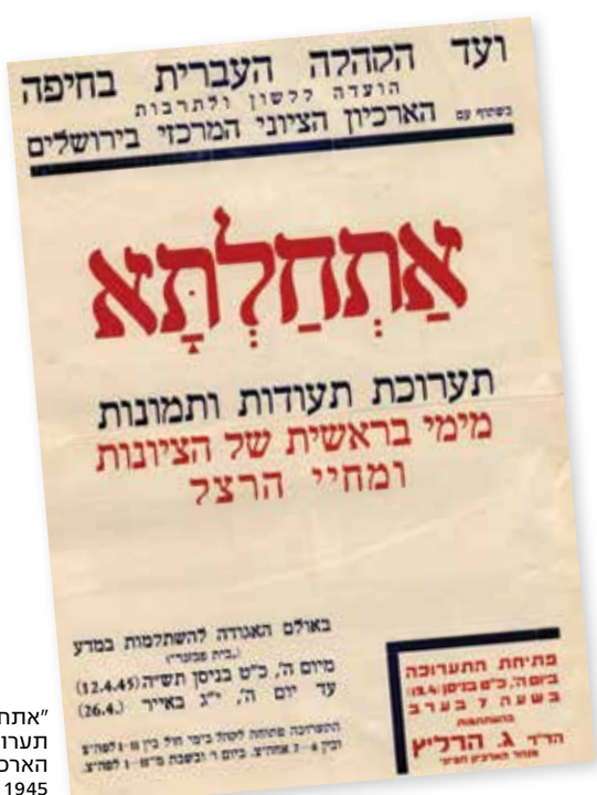
"אתחלתא" תערוכה מבית הארכיון הציוני, 1945

במרץ 1937, לאחר מו"מ ארוך עם נציגי הקהילה היהודית בווינה, הגיע ארכיון הרצל לירושלים והופקד בחדר מיוחד שהוכשר לכך בארכיון הציוני. בין השאר הותנה בהסכם שהארכיון הציוני ימנה לו אוצר מיוחד. ד"ר ביין שפרסם ב־1934 את הביוגרפיה של הרצל והיה כבר דמות מוכרת בקרב ההנהגה הציונית בישראל, היה המועמד המתאים ביותר לתפקיד והוא הוזמן להצטרף כעובד מן המניין וכעוזרו של מנהל הארכיון. ביין נכנס לתפקידו ויצא לקבל את ארכיון הרצל בחיפה. בהגיעו למקום נוכח שהמחסן הצמוד עלה באותו לילה באש, ורק במזל המחסן שבו אוחסן ארכיון הרצל ניצל.