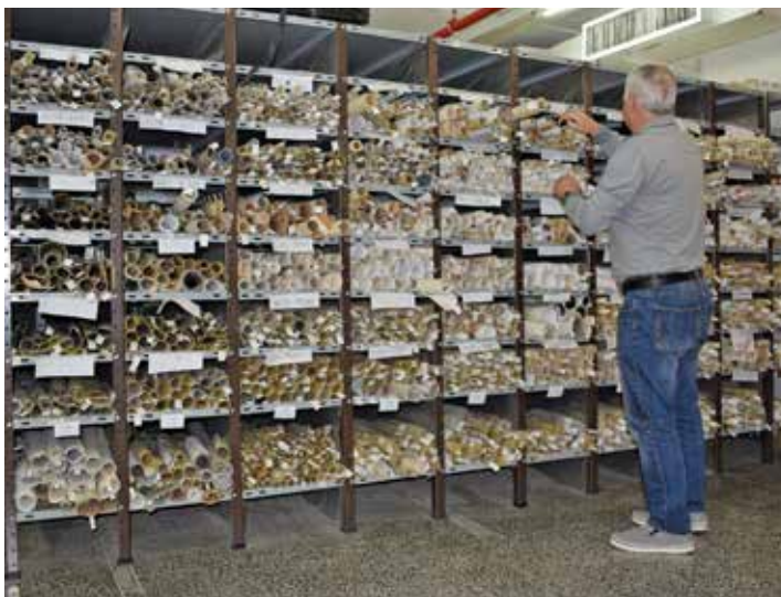
ארכיון המפות, 2019