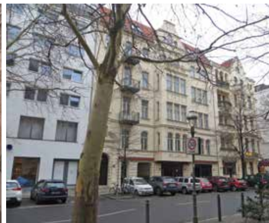
חזית הבניין והמרתף ב־Meineke Strasse מס' 10 בברלין, שבהם שכן הארכיון בשנים 1924-1933