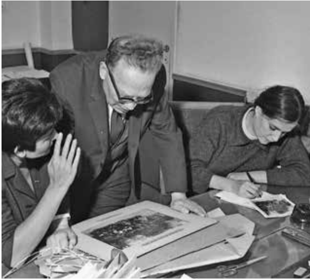
מסירת תצלום מהקונגרס השישי לארכיון ולארכיון ביי