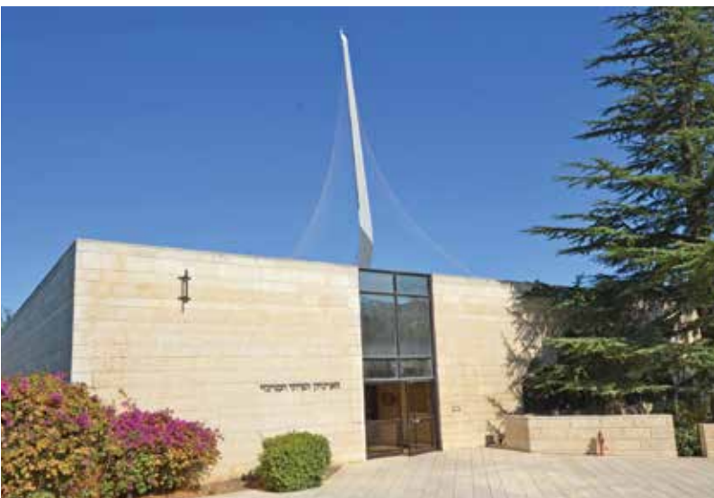
מבנה הארכיון הציוני, 2019