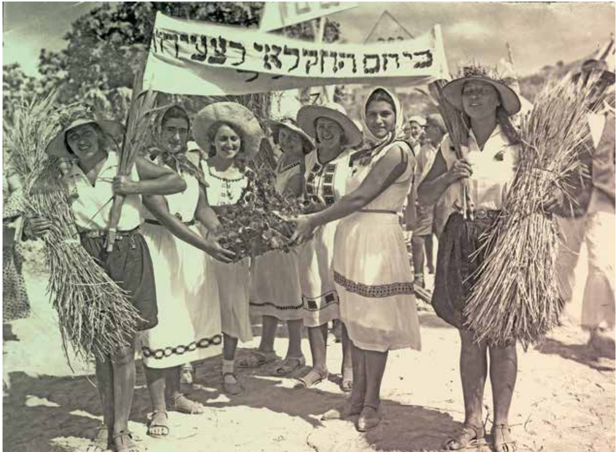
תלמידות ביה"ס החקלאי בנהלל מביאות ביכורים לחיפה, 1932 (אצ"מ)

לאמץ הילולה שתרום את שמה של עירם. חיפה הייתה מרכזם של היישובים החקלאיים באזור (עמק יזרעאל ועמק הירדן), ולכן הם בחרו בחג הביכורים כדי לתת ביטוי לחיבור בין החקלאות העברית המתחדשת לבין חיפה העיר העברית המתפתחת. החגיגות שקוימו במשך מספר שנים יצרו בעיר מסורת מיוחדת במינה.