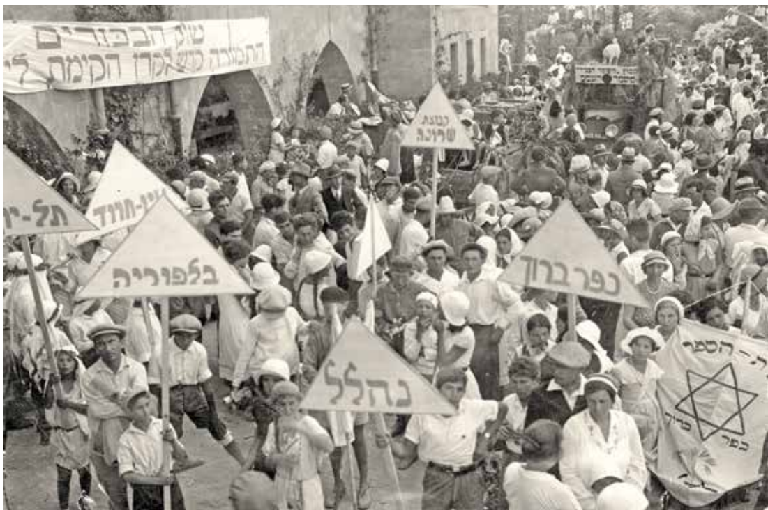
נציגי עמק זרעאל בחג הביכורים בחיפה, 1932

העמק והגליל ויש אף שפסחו על חיפה כעיר שאין להתעכב בה. בקרב תושבי העמק היו התלבטויות רבות האם להגיע לחגיגות בחיפה או לקיימן במתכונת מצומצמת יותר בעמק עצמו. בישיבה שהתקיימה בעפולה השתתפו גם נציגים מחיפה שהצליחו לשכנע את תושבי העמק להגיע לעירם. הם הסבירו שכדאי לרכז את כל הכוחות לטקס אחד גדול ומרכזי שיפיגין את עוצמת ההתיישבות היהודית ואת היותה של חיפה מרכז ההתיישבות היהודית בצפונה של הארץ. כמו כן הם הבטיחו שהאירוע לא יהפוך למעין עדלאידע בסגנון תל אביבי.