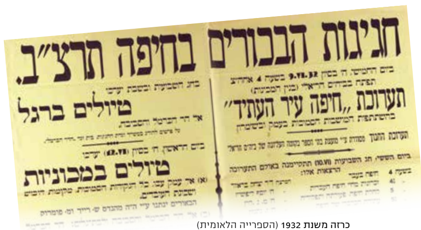
כרזה משנת 1932 (הספרייה הלאומית)

גדול של מגן דוד מואר בפנסי חשמל הוצב ברחוב הראשי של שכונת הדר הכרמל.