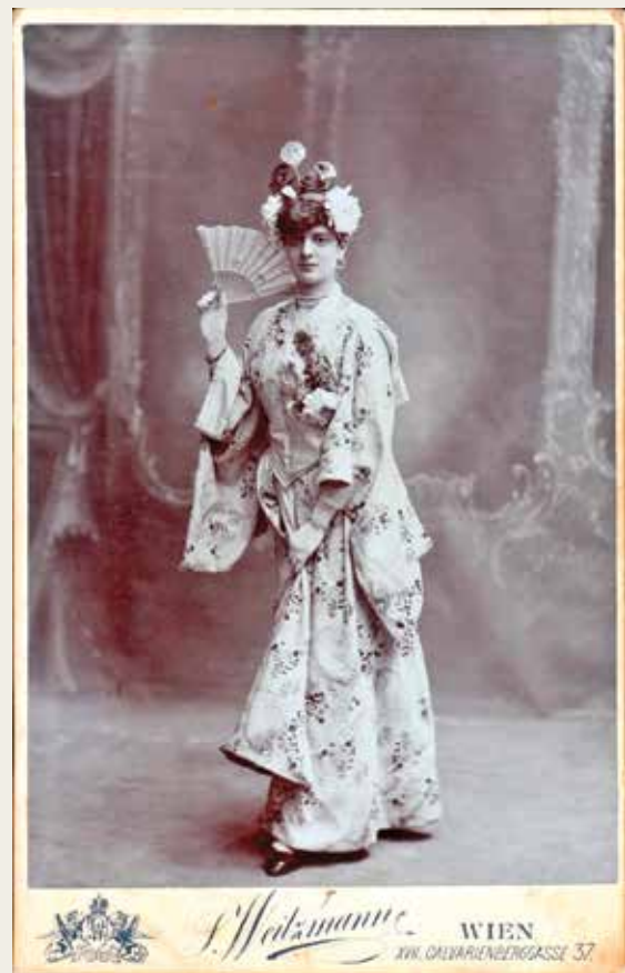
תמונה מ"פוטו ויצמן" בווינה, שנות ה־20

בהול להנהלת עליית הנוער בירושלים, וביקש - "בנימוס רב" - אישור יציאה לכמה ימים מהמושב, כדי לארגן עזרה לאביו. נראה שלא בטח בשליטתו בשפה העברית, ואת בקשתו ובהולה ניסח בגרמנית רשמית ומאופקת. הוא חתם עליה בשמו העברי והגרמני גם יחד: