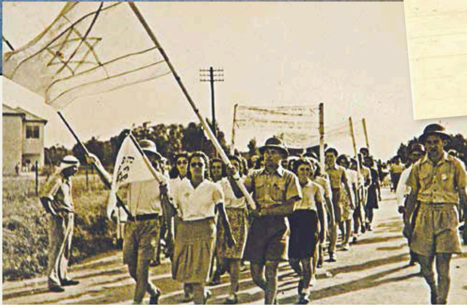
תהלוכת מחאה בעפולה (?): "לא יכון שתוף פעולה עד שתקום מלכות ישראל"