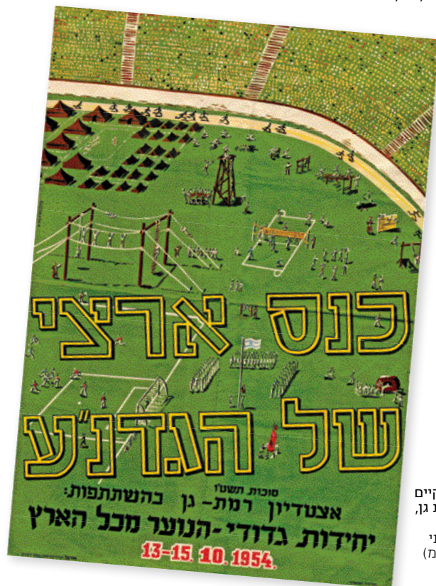
כרזת הכנס הארצי של הגדנ"ע שהתקיים באצטדיון רמת גן, 1954

לאתגרים האחרים שעמדו בפני העיר הצעירה "בזמן של חוסר בתי ספר, דרישות של קליטת עליה גדולות, צרכי שיכון לעולים, אין לקחת את הלוקוס של הקמת מפעלים". אנשי קריניצי התייחסו עתה בפעם הראשונה בהרחבה לטיעונים בעד הקמת פרויקט בסדר גודל זה: "האצטדיון יהיה לתפארת עירנו ולמדינה כולה"; "המפעל ההיסטורי של המכבייה השלישית אופשר רק הודות לאצטדיון שנתן את הפרסום הרב וההדר בכל העולם על רמת גן"; "רק הודות לו (האצטדיון) זכינו לחזות במפגן הצבאי הגדול שמלא את ליבנו שמחה וגאווה על בנינו ובנותינו"; "יש הרושם שכל דברי הביקורת נובעים מקנאה [...]". האצטדיון שרמת גן הקימה הוא לתפארת העיר והמדינה כולה".