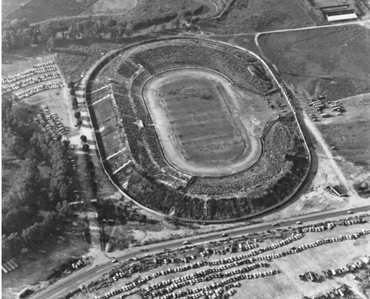
אצטדיון רמת גן, שנות ה-50