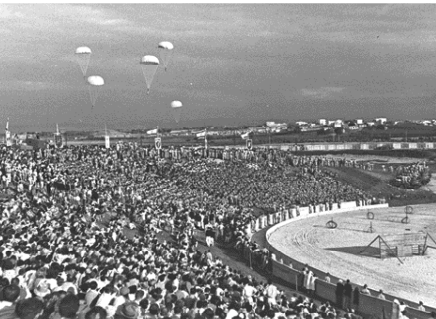
טקס הפתיחה של המכביה השלישית (לע"מ)