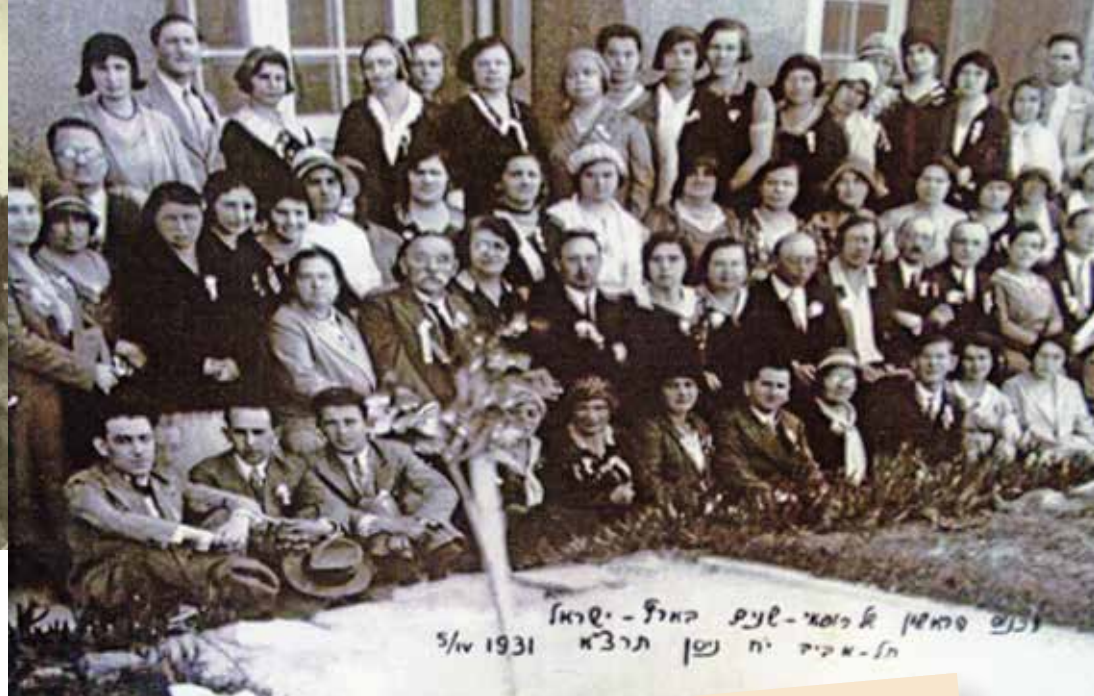
משתתפי הכינוס הראשון של רופאי השיניים בארץ ישראל, תל אביב 1931