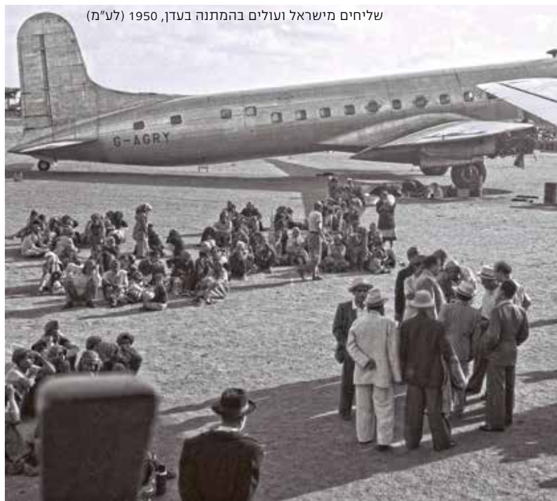
שליחים מישראל ועולים בהמתנה בעדן, 1950