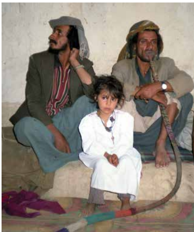
יהודים בצעדה שבצפון תימן, 1986

מלחמת העולם הראשונה שינתה את פני האזור מטריטוריה עות'מאנית, תחת ריבונות מוסלמית אחת, לישויות לאומיות ופוליטיות נפרדות, מרביתן בשלטון בריטי או צרפתי. תימן, לעומתן, חזרה להיות מדינה עצמאית בהנהגת אמאם - מנהיג