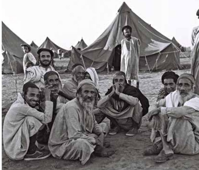
מחכים ל"כנפי הנשרים" מישראל, מחנה חאשד, דצמבר 1949