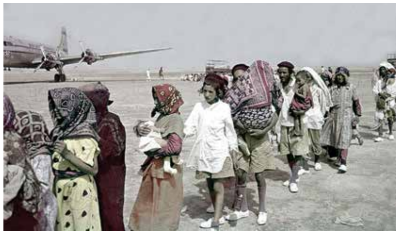
עולים למטוס בעדן, 1951

בשנת 1929 קיבלה הסוכנות היהודית את האחריות לחלוקת רישיונות העלייה. הסוכנות חילקה אותם בארצות השונות בהתאם למעין "מפתח מפלגתי" שתאם ליחסי הכוחות בקונגרס הציוני. הפעילות הציונית המאורגנת בארצות המזרח התיכון וצפון אפריקה הייתה מצומצמת לעומת מדינות אירופה, ולכן מספר הרישיונות שקיבלו היה קטן יחסית. מביניהם, יהודי תימן קיבלו את המספר הגדול ביותר של רישיונות העלייה. הדרישה לרישיונות עלייה מתימן הייתה גדולה יותר מבארצות האסלאם האחרות, ויוצאי תימן במוסדות הציוניים בארץ ישראל פעלו כקבוצת לחץ שנאבקה למען הנותרים בתימן. ידיעות על סיכויי להשגת סרטיפיקטים "פנויים" המחכים בעדן היו באותה תקופה גורם מרכזי שהניע את ההגירה היהודית מתימן. רבים מהיהודים שהגיעו לעדן המתינו לסרטיפיקטים חודשים ואף שנים, בתנאי מחיה קשים.