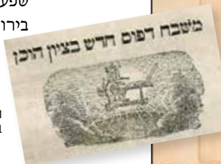
המכש הראשון של הלוי וסולומון בספרם "שבט מוסר"