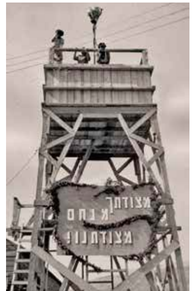
קיבוץ דן ביום הקמתו, 4.5.1939 (ארכיון קיבוץ דן)

שבועיים לאחר מכן, ב-17 במאי 1939, פרסמו שלטונות המנדט הבריטי את "הספר הלבן" של פאספילד. המסמך כלל מגבלות על העלייה היהודית ועל רכישת הקרקעות של יהודים מידי ערבים. במחאה על גזירות הספר הלבן פתח היישוב היהודי במאבק נגד הבריטים, אולם פרוץ מלחמת העולם השנייה הביא להחלטת המוסדות להפסיק את הפעולות נגד הבריטים ולהתמקד בהתיישבות ובעלייה הבלתי לגאלית. מאמץ יישובי מיוחד נעשה בצפון עמק החולה, וכך קמו שלוש מצודות נוספות: בית הלל בינואר 1940 כמושב שיתופי, שאר ישוב בפברואר 1940 כמושב של אנשי "הנוער הציוני", ונחלים ב-1948 כמושב של "הפועל המזרחי". בית הלל הוקם על שטח שלא נועד ל"מצודות אוסישקין" ולכן לא נחשב בתחילה במניין, ואילו נחלים נקרא "מצודת אוסישקין ד" למרות היותו היישוב החמישי בסדר ההתיישבות. המצודה השישית לא עלתה בסופו של דבר על הקרקע, כנראה בשל טענת הקיבוצים השכנים כי הקרקע שקיבלו אינה מספיקה ולכן אין מקום להקמת יישוב נוסף. התנגדותם כוונה גם להקמת מושב נחלים.