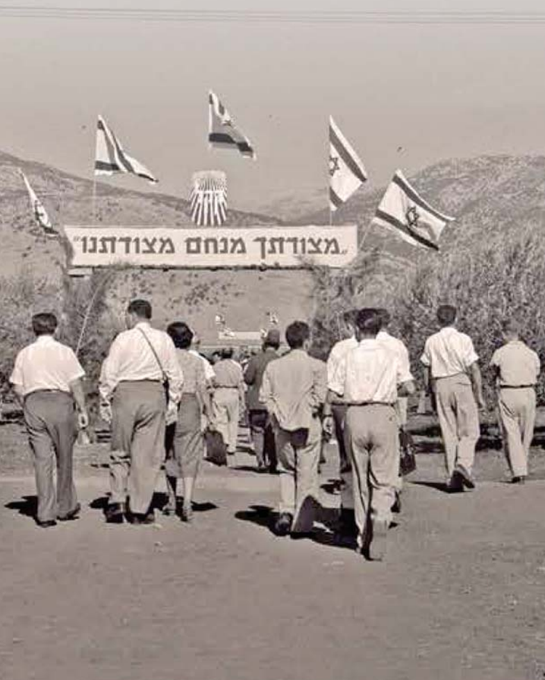
חנוכת מוזאון "בית אוסישקין" בקיבוץ דן, 1951

עקב הדלילות היישובית באצבע הגליל הוצעה בראשית 1939 תכנית להתיישבות על אדמות שרכשה קק"ל בקצה הצפוני-מזרחי של עמק החולה, באזור שבו נבעו מקורות הירדן וסמוך לגבול סוריה ולבנון. האדמות היו בבעלות אפנדים ערבים שישבו בסוריה ובלבנון, ורוב יושביהן היו בדווים בני הע'ווארנה וכן פליטים שנמלטו מנקמת דם ומשלטון החוק ומצאו מקלט באזור הנידח ומוכה המחלות. מנחם אוסישקין עמד אז בראש קק"ל, שהייתה אחד הגופים המרכזיים ב"מוסדות המיישבים" בצד הסוכנות היהודית. לרגל יום הולדתו ה-76 ביקש אוסישקין להנציח את שמו באמצעות הקמת שישה יישובים חדשים באצבע הגליל, שייקראו "מצודות אוסישקין" (לא הייתה זו הפעם הראשונה שבה הונצח אוסישקין עוד בחייו - קדמו לה החלטת