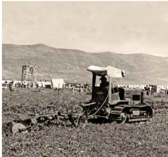
"אין חריש עמוק בלי נשק" - הקמת "מצודת אוסישקין א" (דפנה), 3.5.1939 (ארכיון התמונות, יד בן-צבי)

הקונגרס הציוני להקים כפר על שמו והסבת שם הרחוב שהתגורר בו בירושלים לרחוב אוסישקין, ביום הולדתו ה-70). התכנית אושרה סופית בקיץ 1939 בהנהלת הסוכנות היהודית, שהחליטה להקים באצבע הגליל ב"חבל אוסישקין" יישובים אשר ייצגו את כל הזרמים בתנועה הציונית וינציחו את שמו ואת פועלו של נשיא קק"ל הנכבד: