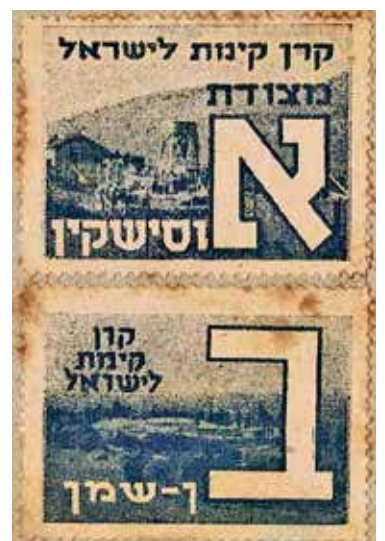
בולי קק"ל, 1940