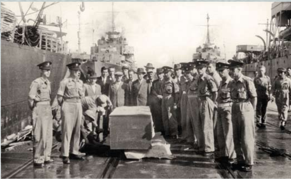
ארונו של אימבר נפרק מהסיפון בנמל חיפה, מרץ 1953 (הארכיון הציוני המרכזי)