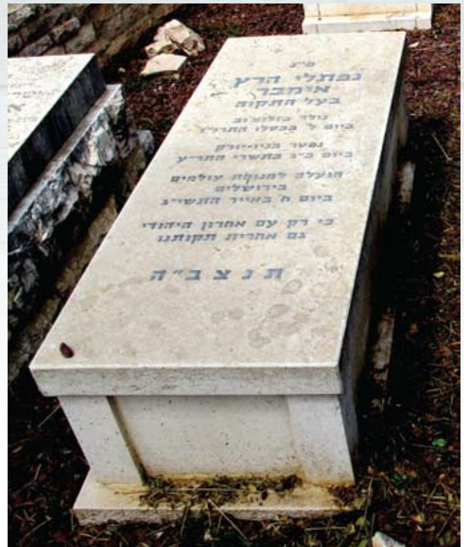
קברו של אימבר בהר המנוחות, 2013

אצל רבים שררה תחושת החמצה בעקבות ההלוויה, הרגשה שאותה היטיב לתאר נתן אלתרמן ב"הטור השביעי": "כן, כמסתבר זה דרך המנונים: / מתחילים בתחום של תמהונים שונים / ולבסוף הנה... פתאם או לא פתאם... / המצעד עובר נכון כנכון היום. / ולבסוף מובא פיטן עברי לנוח / ושירו עצמו בנהמת כלי רוח, / מלווה אותו, עם הלמותו של תף, / כלוות איש זר... וכך יפה וטוב". ב-1955 הונחה מצבה על הקבר ועליה נחקק: "פ"נ נפתלי הרץ אימבר בעל התקווה, נולד בזלוצ'וב ביום ל' בכסלו התרי"ז, נפטר בניו יורק ביום כ"ג בתשרי התר"ע, הועלה למנוחת עולמים בירושלים ביום ח' באייר התשי"ג, כי רק עם אחרון היהודי גם אחרית תקותנו, תנצב"ה". ב-1958 נקבר בסמוך ההיסטוריון וחוקר הספרות יוסף קלוזנר, שהיה יושב ראש הוועדה להעלאת עצמות אימבר.