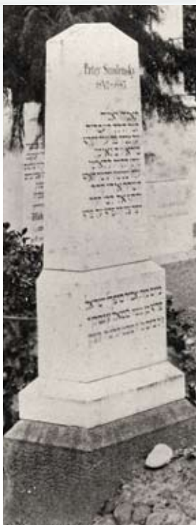
מימין: ארונו של סמולנסקין בחצר המוסדות הלאומיים, יולי 1953 משמאל: קבר סמולנסקין במראנו

שהפליגה לישראל. מחיפה עשה מסע הלוויה את דרכו לירושלים, עם תחנות בפתח תקווה ובתל אביב. בירושלים הוצב הארון בחצר משרד החינוך ברחוב הנביאים בירושלים,