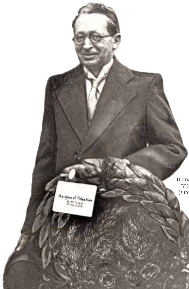
יצחק בן-צבי עם זר "יהודי פלשתינה"

באנו לשם 'בלבוש מלכות' כדת וכדין [...] בבגדים המזכירים את מלבושי האבירים מימי הביניים וחרב בכלל זה [...] זכות מיוחדת ניתנה לגברות לבחור את הצבע והגון, ואשתי השתמשה בזכות זו וחרגה על שמלתה הלבנה אזור תכלת עם כתובת עברית משובצת באותיות 'ארץ ישראל' ומגן דוד באמצע.