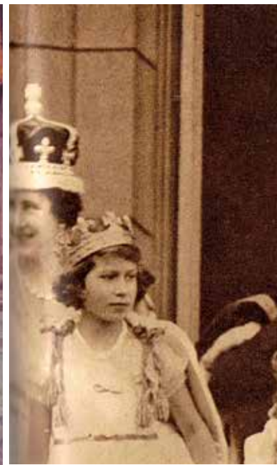
הוד מלכותם המלכה אליזבת' והמלך ג'ורג' השישי, "מלכותם" והוד יצחק רחל ינאית

אנשי הממשל גישו אם נכונות השמועות בעיתונות כי "הוועדה המלכותית" – ועדת פיל, שחקרה את הגורמים לפרוץ המרד הערבי – תמליץ על חלוקת הארץ. בדיווחיו למוסדות בארץ סיפר בדאגה כי בגלל "המצב הבלתי ברור אשר בו נמצאת הארץ לפני הוועדה המלכותית [...] אין יכולת להשיג כסף בסיטי [...] כל עוד לא תצא החלטת הוועדה אין לקוות לכך שישגו כסף ושיסכימו להלוואה".