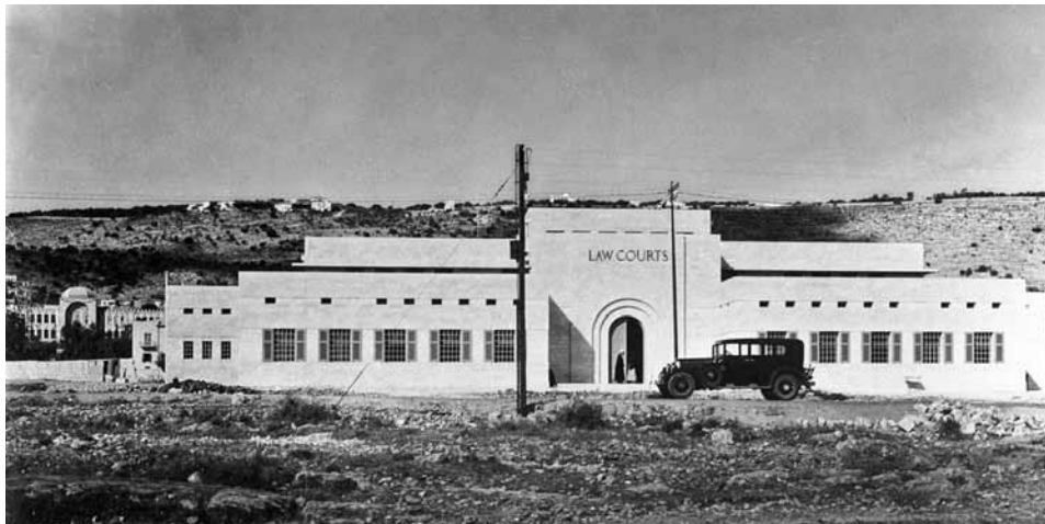
בית משפט השלום, הדר הכרמל, חיפה, שנות העשרים של המאה העשרים