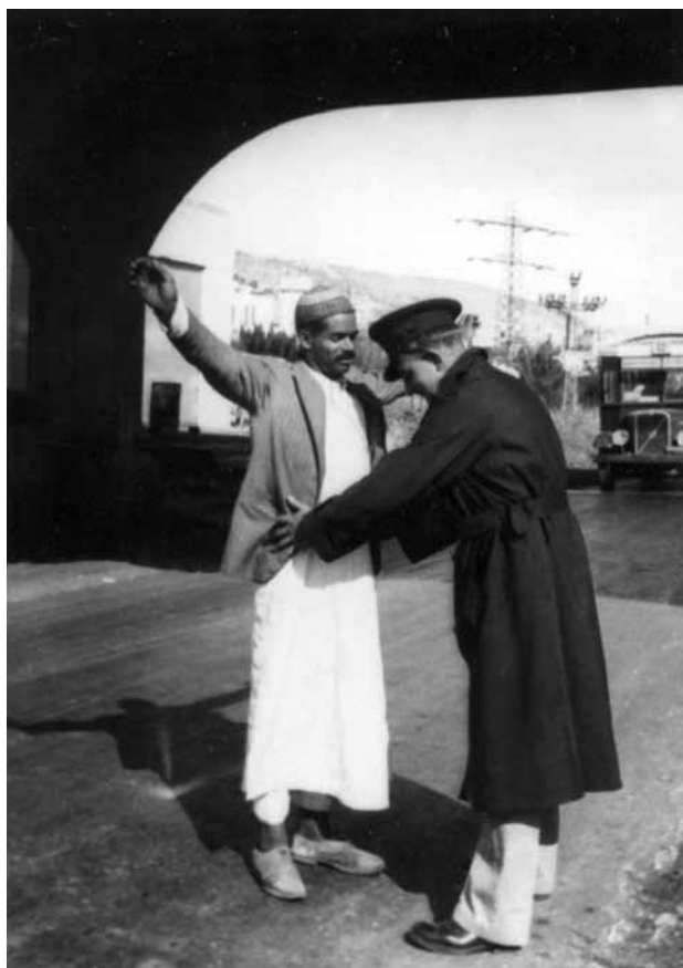
שוטר בחיפוש לגילוי נשק, חיפה, שנות השלושים של המאה העשרים

ידי בתי המשפט הצבאיים, ומנגד היה הפחד מנחת זרועם של המורדים. 28 נקארה לא היה נתון לאיום מצד המורדים, ובכל זאת נחשפים בדבריו הפחד להיחשב בוגד ומשתף פעולה עם המשטרה והצורך להיות מחושב וזהיר. כל זאת אף שמגע עם קציני המשטרה נדרש ממנו במסגרת תפקידו כעורך דין שהגן על המשתתפים במרד. כוחם של המורדים להשליט בחיי היום-יום את סדר היום שלהם ניכר גם כשהוא מספר כיצד אסרו על נציגי הכנסייה הפרוטסטנטית לגבות מנקארה שכר דירה.