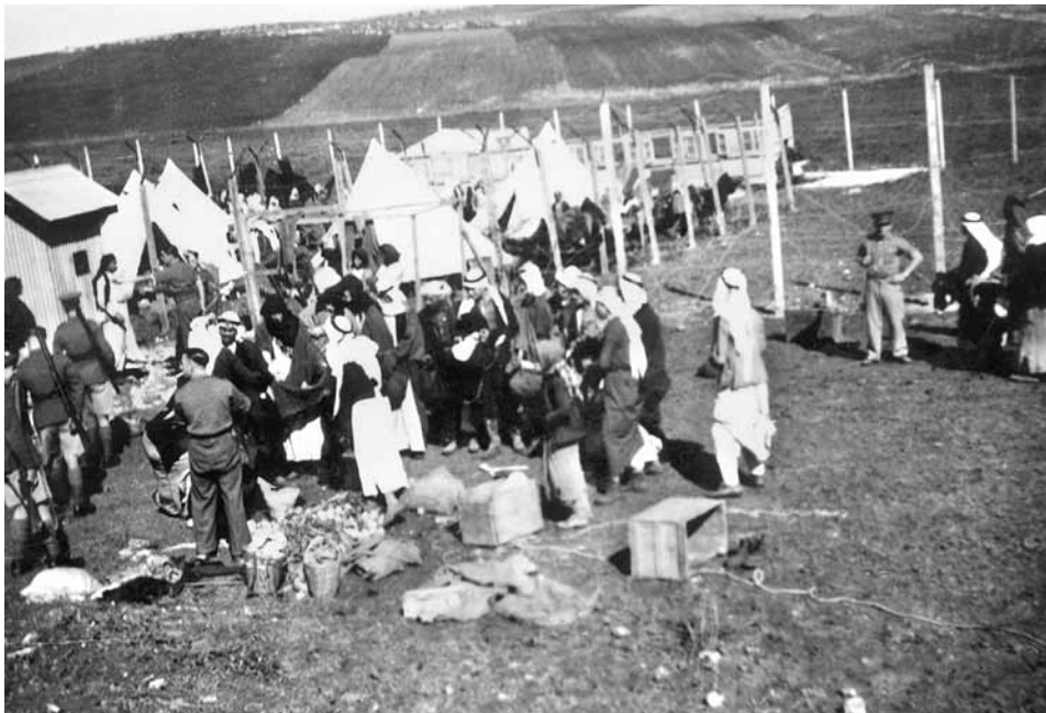
מחנה הסגר לעצורים ערבים בגליל, 1938

ההנהגה הערבית סירבה לחלוקה 17 על כרעיה ועל קרבה וללא כל הסתייגות. כך החלו המהומות מחדש ביוני 1937, ונמשכו עד פרוץ מלחמת העולם השנייה באוגוסט 1939. 18 השלטון הבריטי הודיע על תקנות לשעת חירום ונערכו מעצרים, חיפושים ומאסרים. הקולוניזטורים הבריטים הקימו מחנה מעצר בצפון, במזרעה, עוד אחד בעתלית, מחנה שלישי בצרפנד, רביעי בעוג'ה אלחפיר ואיני זוכר היכן עוד. מספר העצירים הגיע לכמה אלפים. בתחילה היו העצירים מקרב ההנהגה והנכבדים, אבל בהמשך התרחבו המעצרים וכללו פלאחים, פועלים ומשכילים. הוקמו בתי משפט צבאיים, האחד בחיפה ושני בדרום.