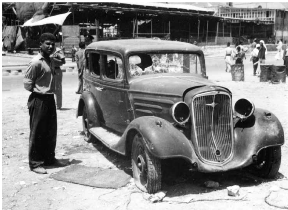
רכב שנפגע מפיצוץ, חיפה, 23 ביולי 1938