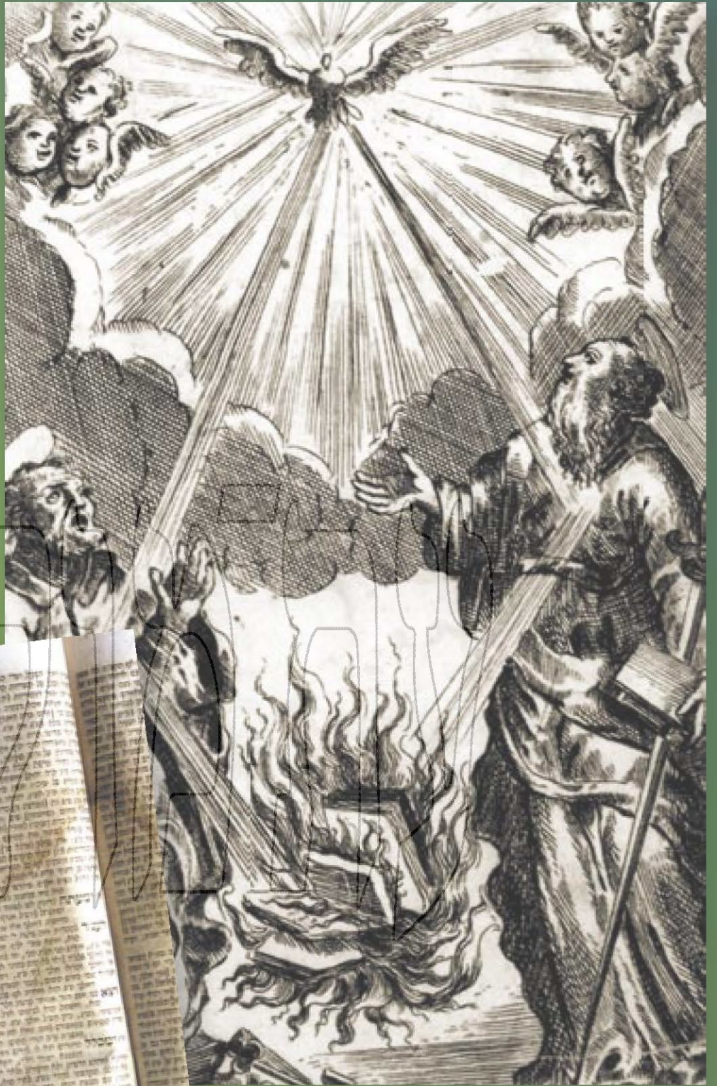
מסרום ופאלום שורמים את "המפרים האטורים" (תמריט, ראשית המאד-ה-18)