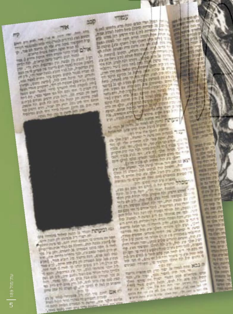
דוגמא למחיקת זפת בספר "עמודי אור" (שאלות ותשובות לרב יחיאל הלר) קויגסברג תרט"ו (כנראה מהצמורה הרוסית נכסייתית)