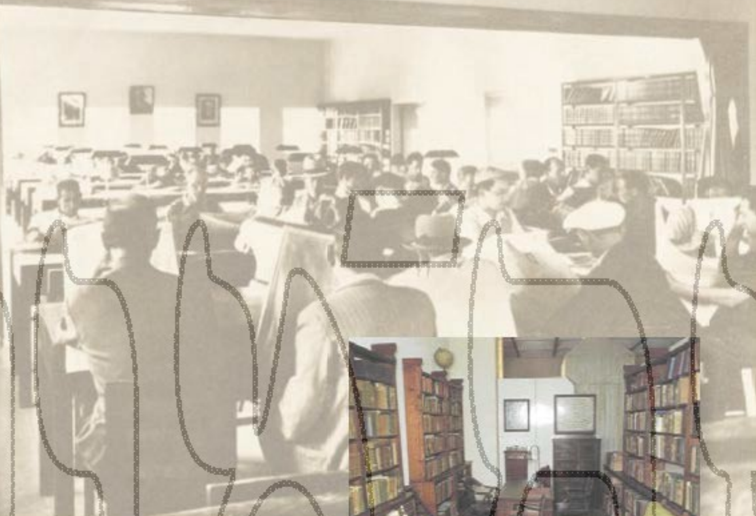
אולם הקריאה בשנת ה'תר"ם