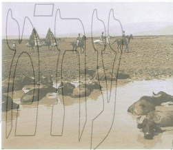
סינר: עסק החולה על רקע הרמון, 1627. השפלה: למסוס בגינת החולה, 1946. גילום: זולמן קלמן, אופק ההגותים הלואמי

ויאמרו לו, למה לא ינאסם החודים כמסינרם לבקש ליהודי ארד שנהרג נאו וח נאו, כפי זה יא כי החודים ויאמר להם חסן המכה, חוקי היה המעה ולמה הרמחו