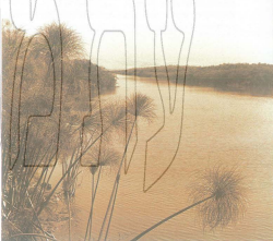
בסא בחולה, צילום: חרין כהן, 1955, אוקף העגונים הלאוני

מגנשה זה מבוטס על עגדותו של יצחק רחוקה, שסיקר ביצר בעת שחתו ככפר אל רחובות ובי"ד ק"ט מפגין-טרה לרמסקו שסם כעריבם שבאו לבית השיח. הם סיפרו לו על שני יהודים