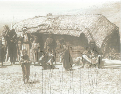
ענק החולה: בודים ליד חושה בנות מלטה, אספן ואב ילמי, ארסקי והמפוסת יד ברנבי

החסי את ראשו מצליל, את טופו החליבו העודדים באגב קרש, הוא ימת החולה, בץ השאבים.