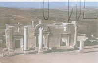
למטה: בית הכנסת בכפר נמרית. סידון: חצבת המזרח של קיחל חצינו. המסלול חזרת הבניין כיום. בילדו: חרשים חלק