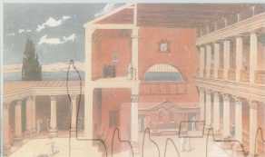
קול התנ"ך: חזון בית הכנסת בנבט נבט